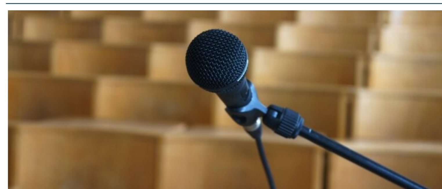
Mikrofon vor leerem Hörsaal.

Aktuelle Zeiten, Vorträge und Abstracts entnehmen Sie bitte unserer Website.