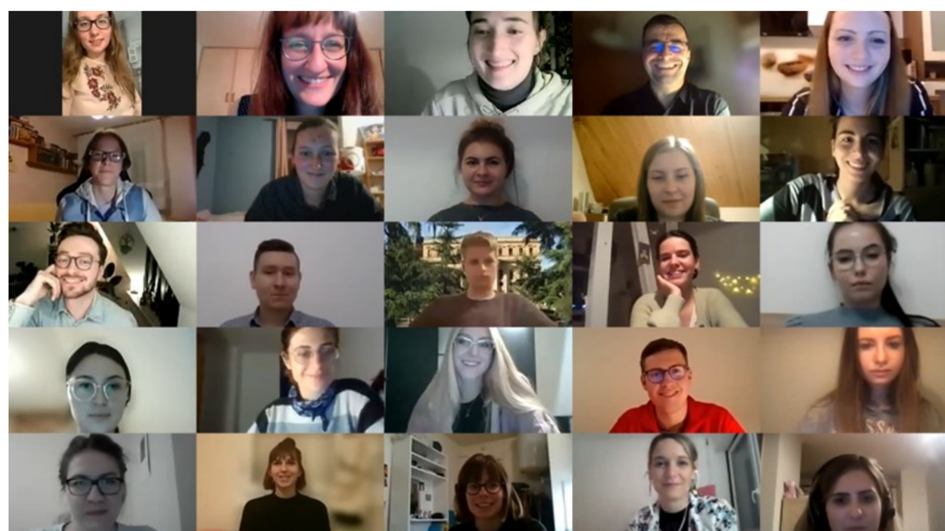
Screenshot aus einer Spielrunde mit Studierenden aus Paris, Poznań und Jena in den interkulturellen Planspielen